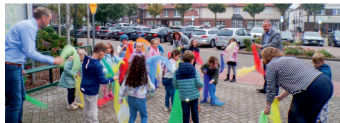
Zum Weltkindertag hissten Mädchen und Jungen der Kindertagesstätte St. Elisabeth am Rathaus eine selbstgestaltete bunte Fahne.

* 1 altersübergreifende Gruppe 1 altersübergreifende integrative Gruppe