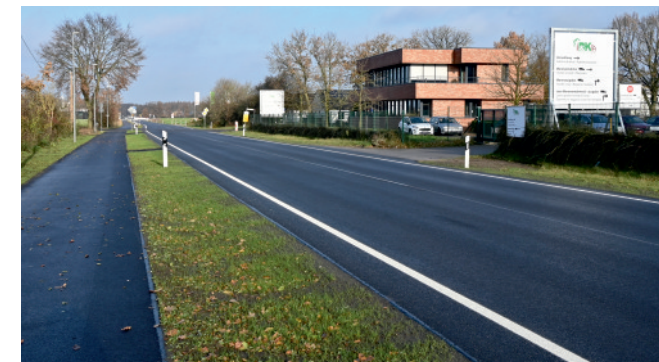
Im neuen Gewand: Die grundsanierte Industriestraße.

Gemeinde Holdorf ...seit mehr als 195 Jahren für Sie da!