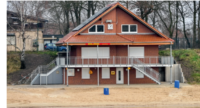
Die sanierte DLRG-Wasserrettungsstation am Heidensee.